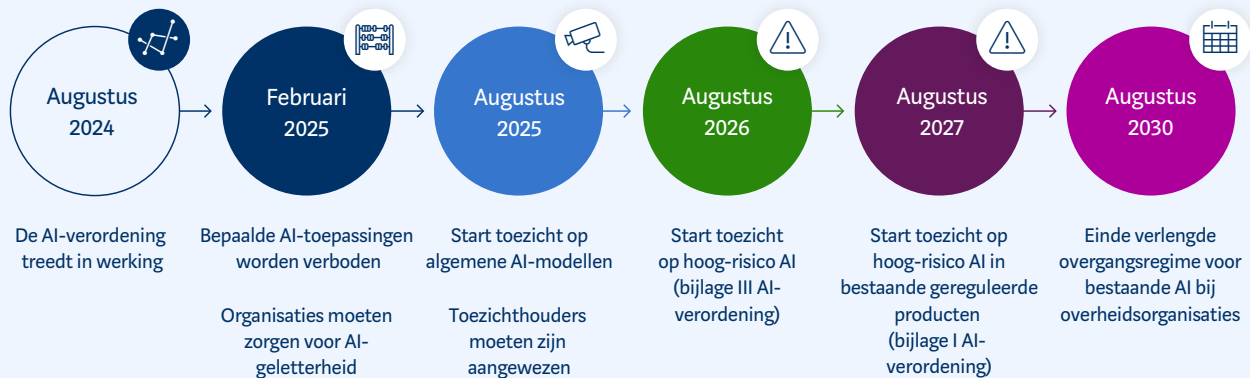
FIGUUR 2: DE AI-VERORDENING TREEDT DE KOMENDE JAREN GETRAPT IN WERKING

De AI-verordening vormt een nieuwe basis voor het toezicht op AI en algoritmes, maar niet alle AI-systemen worden aan dezelfde eisen onderworpen. Dit is afhankelijk van de risicocategorie waarbinnen de toepassing valt. De vereisten voor de verschillende categorieën zullen gefaseerd in werking treden (zie figuur). Systemen met een onaanvaardbaar risico zijn verboden, bijvoorbeeld systemen die mensen (onbewust) uitbuiten of manipuleren. Systemen met een hoogrisicotoepassing, zoals die worden ingezet bij werving en selectie of in het onderwijs, moeten voldoen aan strenge eisen. Gedacht kan worden aan risicomanagement (waaronder non-discriminatie), menselijke controle en het bijhouden van documentatie. Systemen met een beperkt risico moeten voldoen aan verschillende transparantie-regels; een systeem dat kunstmatig content genereert moet dit bijvoorbeeld duidelijk markeren.