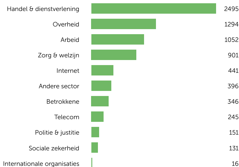
Figuur 1: Verdeling vragen en tips over sectoren